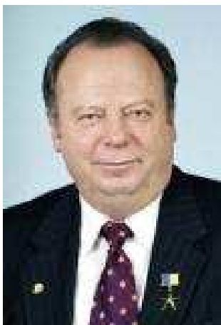
Мельничук Дмитро Олексійович, ректор НУБіП України, академік НАН України та НААН України, Герой України

Бобровицький коледж економіки та менеджменту ім. О.Майнової є відокремленим підрозділом одного із провідних вищих навчальних закладів України – Національного університету біоресурсів і природокористування України, який очолює Дмитро Олексійович Мельничук, Герой України, доктор біологічних наук, професор, академік Національної академії наук і Національної академії аграрних наук.