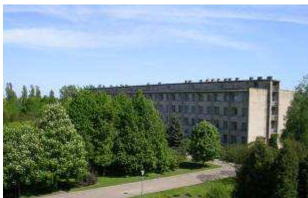
Навчальний корпус у Бобровиці

2008р. – Відокремлений підрозділ Національного університету біоресурсів і природокористування України «Бобровицький