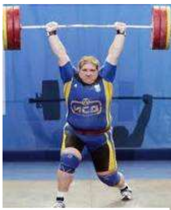
Коробка О. В.

спартакіад, занять спортивних секцій та змагань серед студентів і співробітників коледжу.