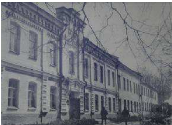
Навчальний корпус у Майнівці