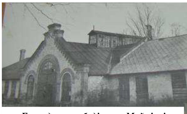
Господарська будівля у Майнівці