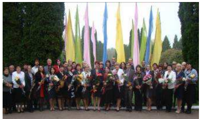
Педагогічний колектив коледжу

коледж живе насиченим життям і впевнено крокує в майбутнє.